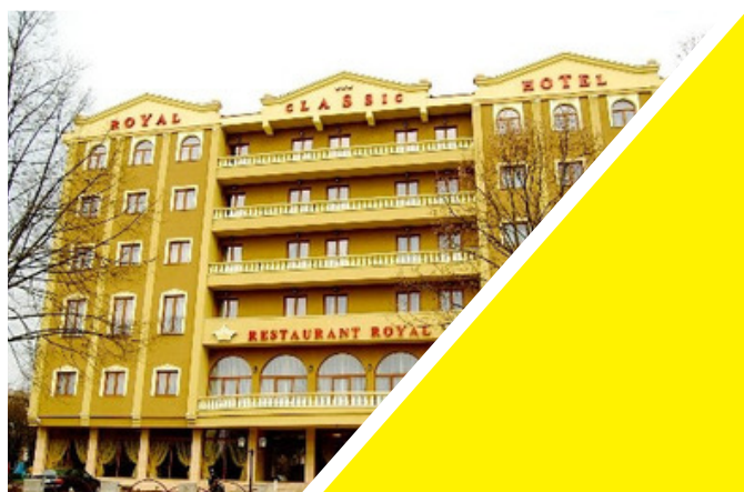
Hotel Royal Clasic Str. Liviu Rebreanu 39

Vă rugăm să consultați invitația trimisă pentru a identifica hotelul la care sunteți cazat(ă). Micul dejun este inclus.